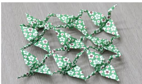
「希望ある明日へつながる おもちゃ作りの可能性」 斎藤照正さん（おもちゃコンサルタントマスター）